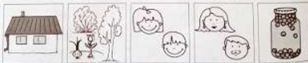
Схема для составления рассказа о даче

Расскажи по картинке о весенних заботах на даче. Используй схему.