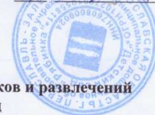
График проведения праздничных утренников и развлечений на 2023-2024 учебный год